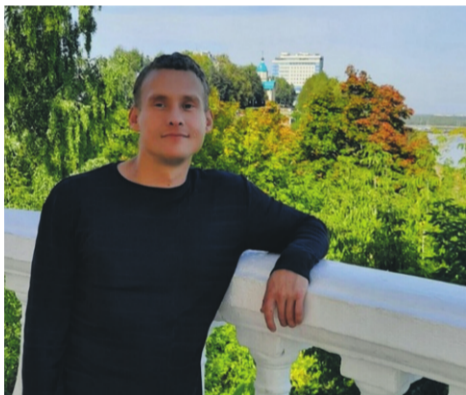
Кировские партийцы помогли сироте обрести дом

Я воспитывался в интернате. Когда выпустился, за мной закрепили жилую площадь, в которой проживали родители. На тот момент на квартире висел долг в 300 тысяч рублей. Около 4-х лет я искал юриста, который поможет выбраться из плачевной ситуации,